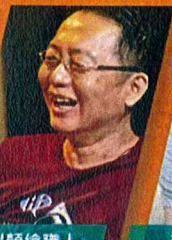
似顏繪職人 傑利小子